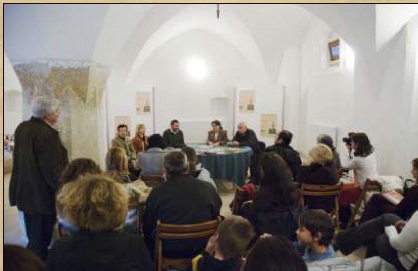
Lansarea cărții / Book launch: Piața Huet. Monografie arheologică (I, II), 24 noiembrie 2007