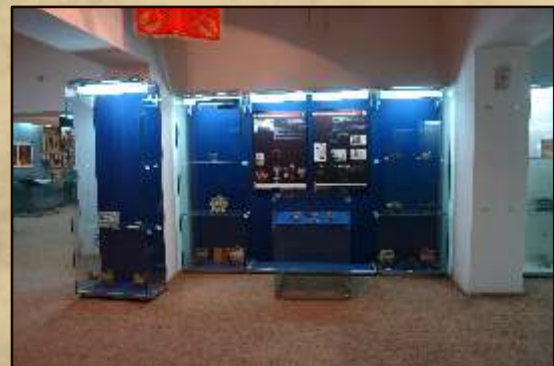
Vernisajul expoziției, expunerea artefactelor Official opening of the exhibition, the layout of artefacts.