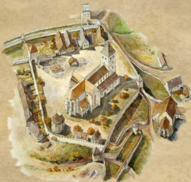
Piața Huet / Huet Square Reconstrucție grafică / Graphical reconstruction: Radu Oltean