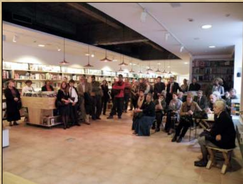
Lansarea volumului la Librăria Cărturești, București Book launch, Cărturești book store, Bucharest