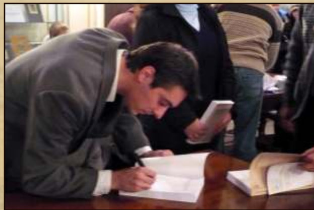
Lansarea cărții / Book launch Biblioteca ASTRA, Sibiu / ASTRA Library, Sibiu