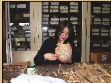
Detalii din efectuarea analizei antropologice. / Details during the anthropological analysis.