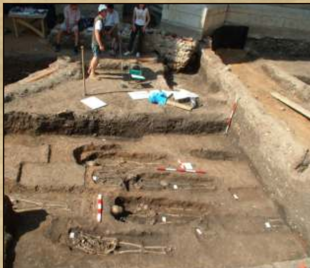
Săpături arheologice în necropola medievală din Sibiu - Piața Huet. / Archaeological excavations in the medieval necropolis of Sibiu - Huet square.