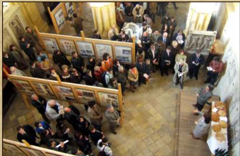
Vernisajul expoziției, Ferula Bisericii Evanghelice din Sibiu Official opening of the exhibition, Ferula of the Evangelical Church of Sibiu,